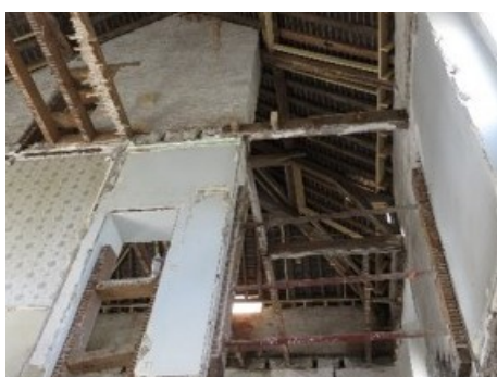
Chantier nouvelle mairie de Monnières