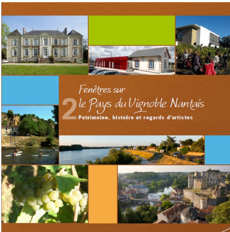
Le tome 2 de Fenêtres sur le Pays du Vignoble Nantais.

Tome 2 : « Patrimoine, histoire et regards d'artistes »